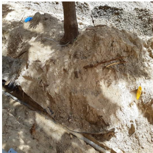
situatie standplaats bomen